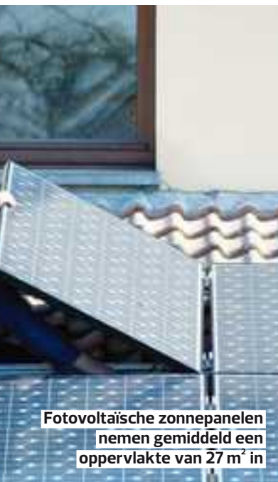
Fotovoltaïsche zonnepanelen nemen gemiddeld een oppervlakte van 27 m 2 in