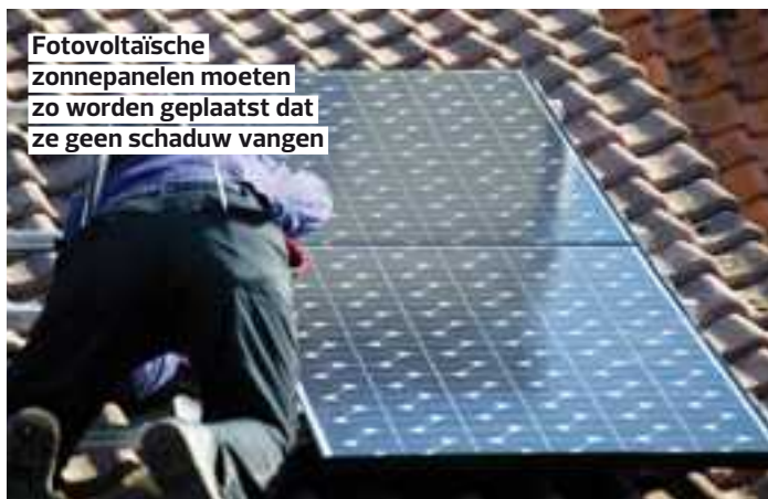
Fotovoltaïsche zonnepanelen moeten zo worden geplaatst dat ze geen schaduw vangen