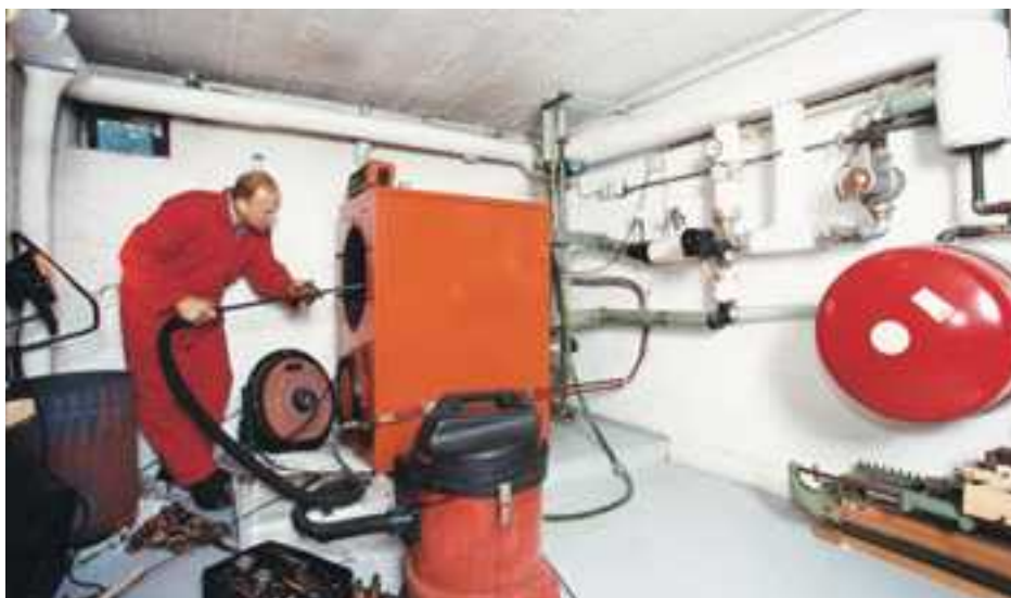
Afhankelijk van de brandstof en het gewest waar u woont, is het verplicht of aangeraden uw ketel jaarlijks, tweejaarlijks of driejaarlijks te laten onderhouden of controleren.

Eerst en vooral blijkt dat de respondenten vooral een beroep doen op onafhankelijke vaklui als er iets aan hun verwarming scheelt, d.w.z. ongeveer in de helft van de gevallen. Op de tweede plaats vertrouwt de Belg vooral zichzelf: 20 % van de respondenten steekt zelf de handen uit de mouwen bij problemen met de ketel. Bij